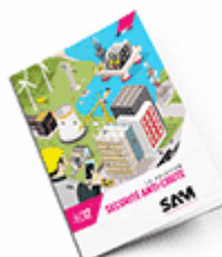
Sécurité anti-chute 2017