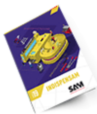
Les outils Indispensables SAM 2019