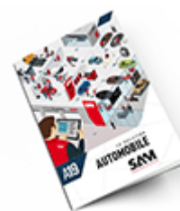
Automobile SAM 2019