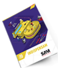
Les outils Indispensables SAM 2019

Découvrez tous nos produits dans nos catalogues en ligne