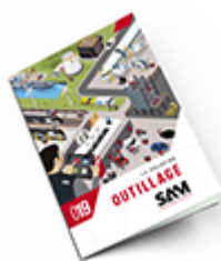
Outillage SAM 2019