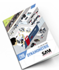
Dynamométrie SAM 2019