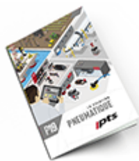
Pneumatique SAM 2019