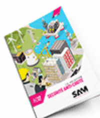
Sécurité anti-chute 2017