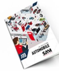
Automobile SAM 2019 Consulter le catalogue