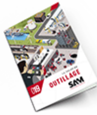
Outillage SAM 2019 Consulter le catalogue