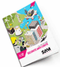
Sécurité anti-chute SAM 2017 Consulter le catalogue