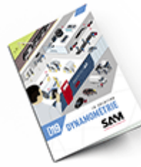
Dynamométrie SAM 2019 Consulter le catalogue