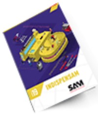
Les outils Indispensables SAM 2019 Consulter le catalogue