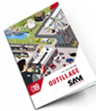
Outillage SAM 2019