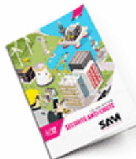
Sécurité anti-chute SAM 2017