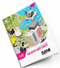
Sécurité anti-chute SAM 2017