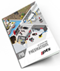
Pneumatique 2019 Consulter le catalogue