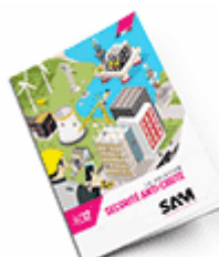
Sécurité anti-chute 2017