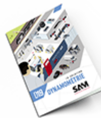
Dynamométrie SAM 2019