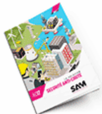
Sécurité anti-chute SAM 2017