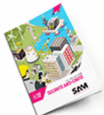
Sécurité anti-chute SAM 2017