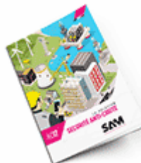
Sécurité anti-chute 2017 Consulter le catalogue