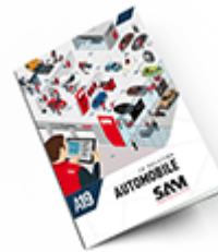
Automobile 2019 Consulter le catalogue