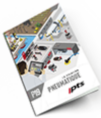
Pneumatique 2019 Consulter le catalogue