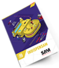
Les outils Indispensables SAM 2019 Consulter le catalogue