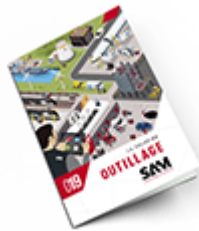
Outillage 2019 Consulter le catalogue