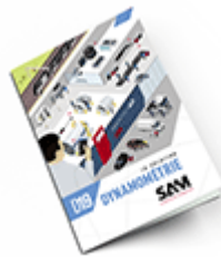
Dynamométrie 2019 Consulter le catalogue