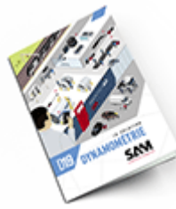
Dynamométrie 2019 Consulter le catalogue