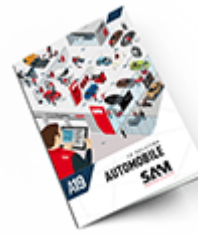
Automobile 2019 Consulter le catalogue