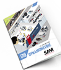
Dynamométrie SAM 2019