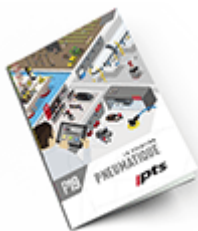
Pneumatique SAM 2019