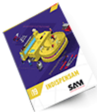
Les outils Indispensables SAM 2019

Découvrez tous nos produits dans nos catalogues en ligne