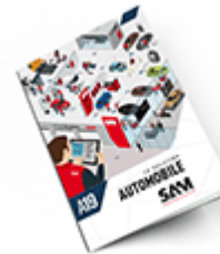
Automobile SAM 2019