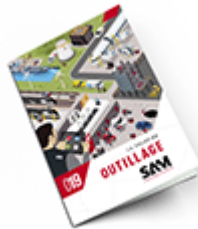
Outillage SAM 2019