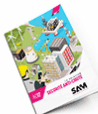
Sécurité anti-chute SAM 2017