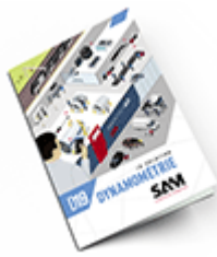
Dynamométrie 2019 Consulter le catalogue