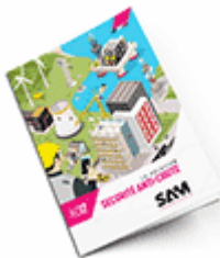
Sécurité anti-chute 2017 Consulter le catalogue