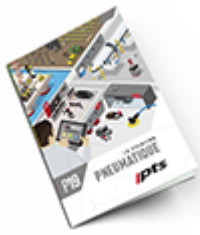
Pneumatique 2019 Consulter le catalogue