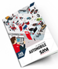
Automobile 2019 Consulter le catalogue