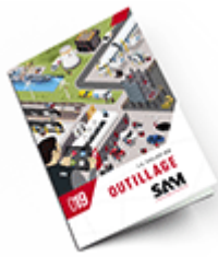
Outillage 2019 Consulter le catalogue