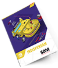
Les outils Indispensables SAM 2019 Consulter le catalogue