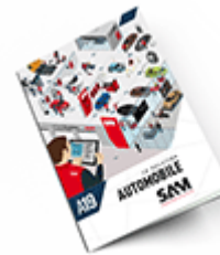
Automobile SAM 2019