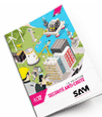
Sécurité anti-chute SAM 2017