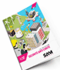
Sécurité anti-chute 2017