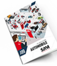
Automobile SAM 2019 Consulter le catalogue