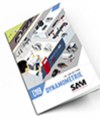
Dynamométrie 2019 Consulter le catalogue