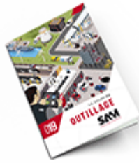
Outillage 2019 Consulter le catalogue