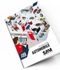
Automobile 2019 Consulter le catalogue