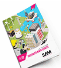
Sécurité anti-chute SAM 2017