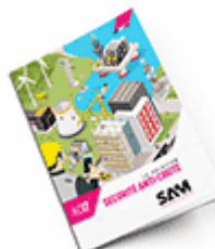
Sécurité anti-chute 2017