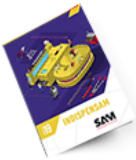
Les outils Indispensables SAM 2019

Découvrez tous nos produits dans nos catalogues en ligne