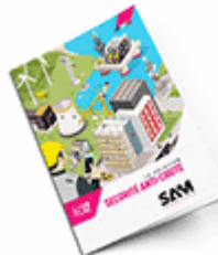
Sécurité anti-chute 2017