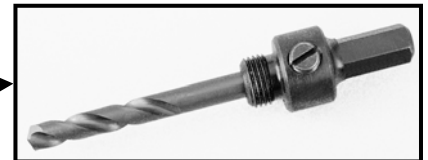
ARBRE 5L Pour application bâtiment