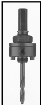
ARBRE 2L Arbre standard