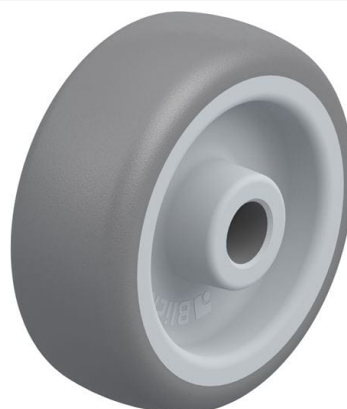
Roue utilisée TPA 50/8G