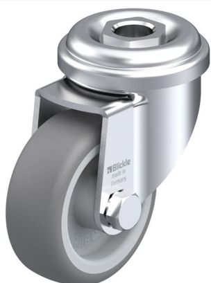
Roulette pivotante correspondante LRA-TPA 50G