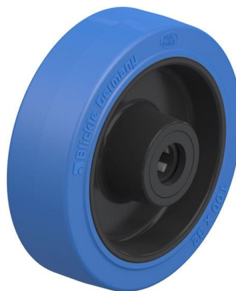
Roue utilisée POEV 100/12R-SB