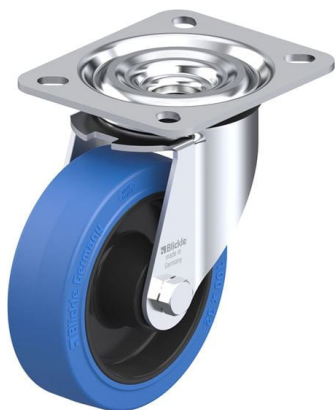
Roulette pivotante correspondante L-POEV 100R-SB