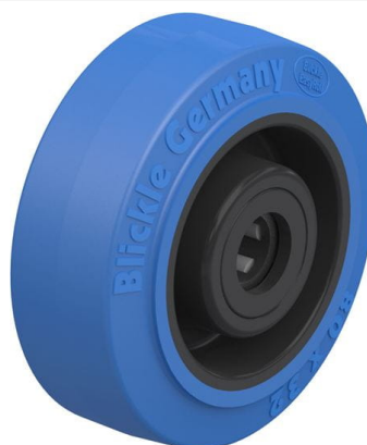
Roue utilisée POEV 80/12R-SB