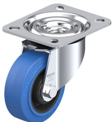
Roulette pivotante correspondante L-POEV 80R-SB