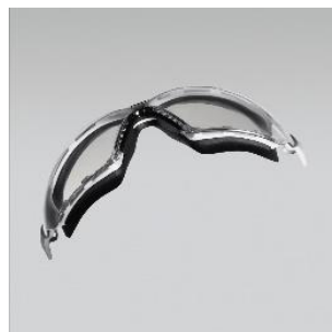
Forme optimale et légèreté