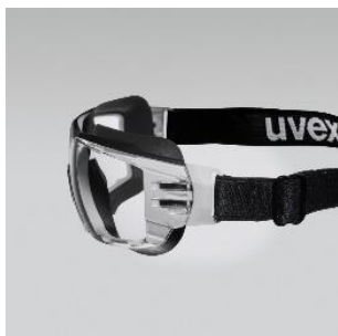
x-tended eyeshield couverture parfaite