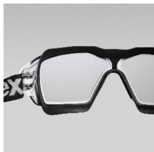
Large champ de vision