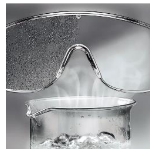
uvex supravision extreme