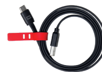
CABLE USB-A / USB-C