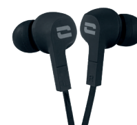
ÉCOUTEURS ÉTANCHES IPX4