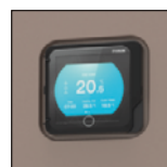
Écran tactile LED