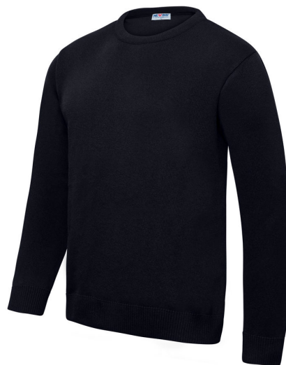
Pull col rond