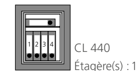
CL 440 Étagère(s) : 1