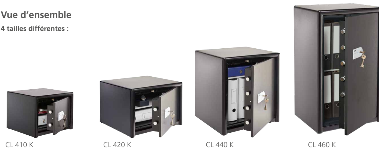
CL 410 K