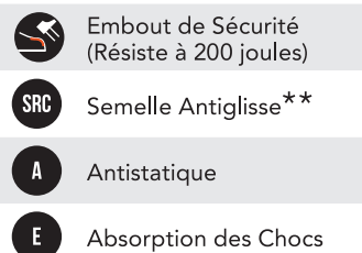
TABLEAU NIVEAU DE SÉCURITÉ