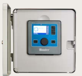
Fixation murale métallique grise ou en acier inoxydable

Hauteur: 15.7" (40 cm) Largeur: 15.7" (40 cm) Profondeur: 6.8" (18 cm)