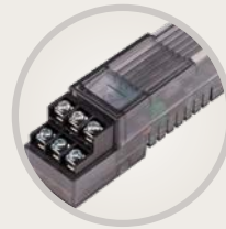
A2M-600 Module d'extension 6 stations avec limiteur de surtension perfectionné