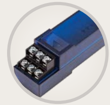
A2C-F3 Module d'extension pour débitmètre 3 entrées