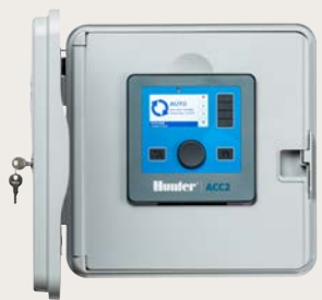
Fixation murale en plastique

Hauteur: 15.7" (40 cm) Largeur: 15.7" (40 cm) Profondeur: 6.8" (18 cm)