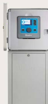
Socle métallique gris ou en acier inoxydable

Hauteur: 16.8" (43 cm) Largeur: 16.8" (43 cm) Profondeur: 7" (18 cm)