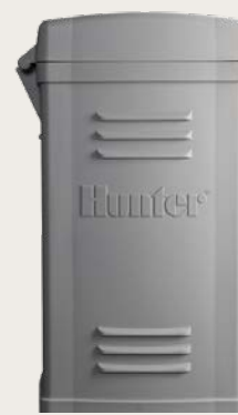
Socle en plastique

Hauteur : 37" (94 cm) Largeur: 15.5" (39 cm) Profondeur: 5" (13 cm)