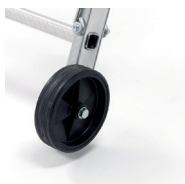
2 roulettes Ø 160 mm pour les déplacements