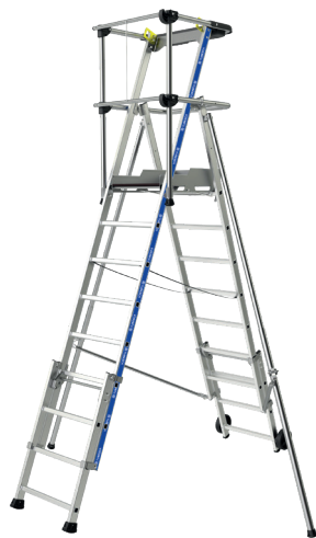
Modèle 8 à 10 marches

Cette PIR-PIRL en aluminium est la référence des plates-formes télescopiques. Disponible en plusieurs modèles jusqu'à 4m46 de hauteur travail ; 3-4 / 5-7 / 8-10 / 8-11 marches. Ses montants renforcés, sa plate-forme large, ses stabilisateurs réglables, son garde-corps rigide semi-automatique, font du Sherpascopic un produit extrêmement robuste et stable. Il dispose d'un porte-outils, de roues de déplacement de 160mm de diamètre et de marches de 80 mm. Il répond aux normes PIR - PIRL et EN 131-7, au décret 2004-924 et est labellisé NF. Le produit fermé fait 38 cm et dispose de sangles de blocage pour le transport. "