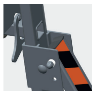
Verrous arrière anti-soulèvement