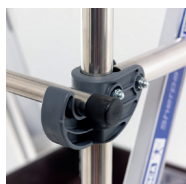
Blocage très fiable du portillon