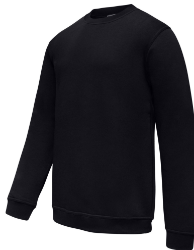
sweat col rond marine