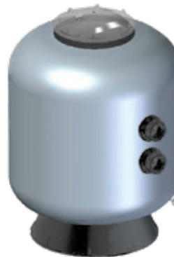
Raccord fileté Ø 500 - Ø 600 - Ø 750 - Ø 900 - Ø 1050-2"