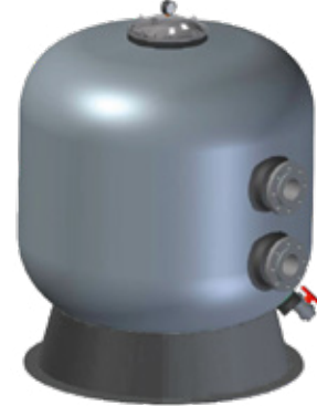
Bride de raccordement de Ø 1050-90 mm et Ø 1200-90 mm