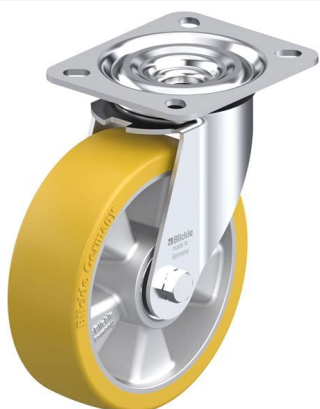
Roulette pivotante correspondante L-ALTH 125K