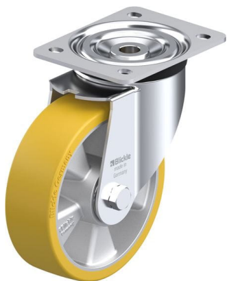
Roulette pivotante correspondante L-ALTH 160K