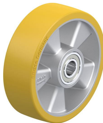
Roue utilisée ALTH 160/20K