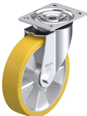
Roulette pivotante correspondante L-ALTH 200K