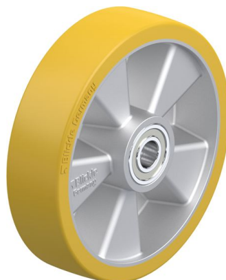
Roue utilisée ALTH 200/20K