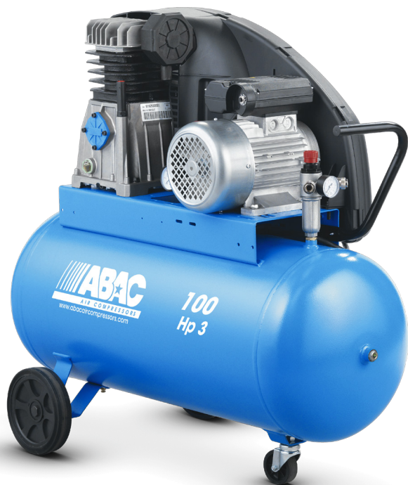
A29B 100 CM3 3 cv, 100 litres, lubrifié