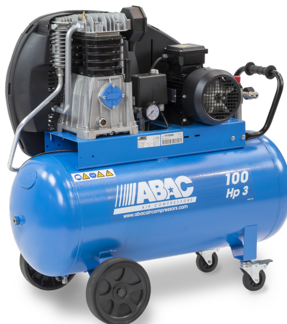
PRO A49B 100 CM3 3 cv, 100 litres, lubrifié