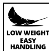
LOW WEIGHT EASY HANDLING