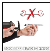
TOOLLESS BLADE CHANGE