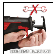
EFFICIENT BLADE USE