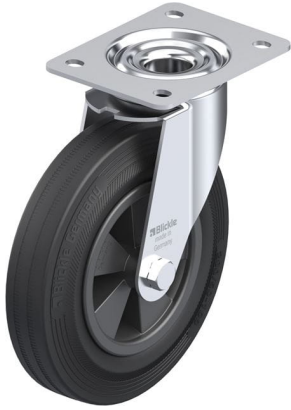
Roulette pivotante correspondante LE-VPP 200G