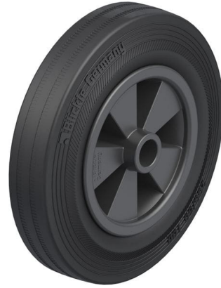
Roue utilisée VPP 200/20G