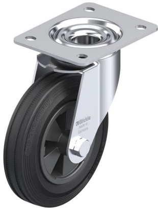
Roulette pivotante correspondante LE-VPP 160G