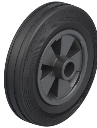
Roue utilisée VPP 160/20G