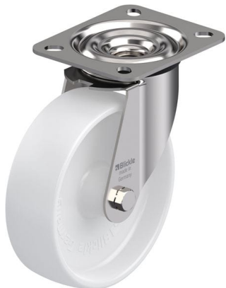
Roulette pivotante correspondante LEX-PO 125G