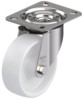
Roulette pivotante correspondante LEX-PO 100G