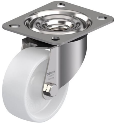
Roulette pivotante correspondante LEX-PO 80G