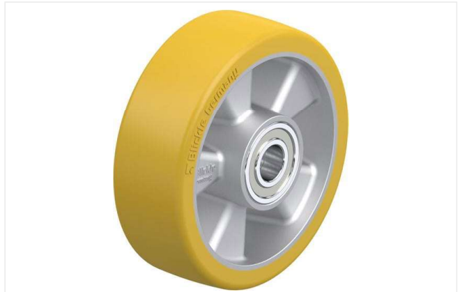
Roue utilisée ALTH 150/20K