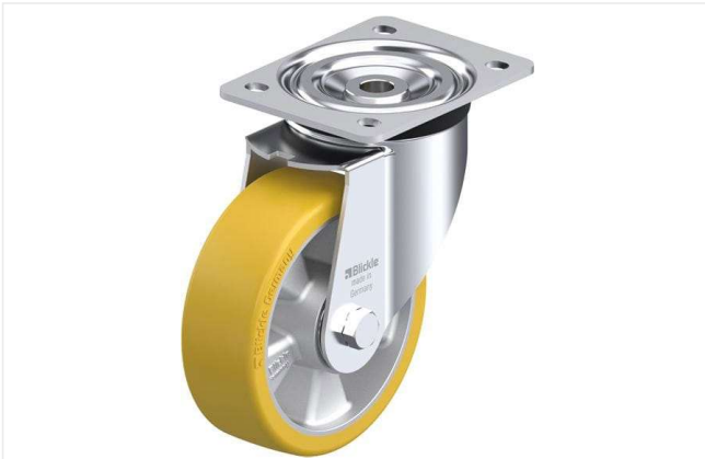
Roulette pivotante correspondante L-ALTH 150K