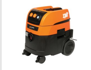
Eurocode 620913 Aspirateur AC 1630P