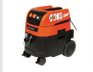
Eurocode 620914 Aspirateur AC 1630PM