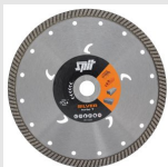
SILVER TURBO-T Disque diamant