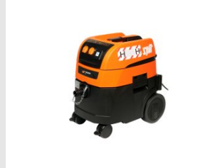
Eurocode 620920 Aspirateur AC 1630 PH