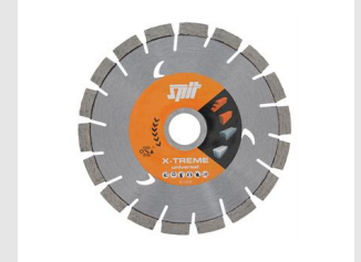
Eurocode 610197 Pack 2 disques XTREME universel D.150