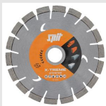
XTREME UNIVERSEL Disque diamant