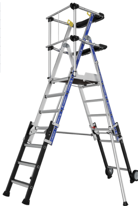
Sherpascopic garde-corps Lisses 5/7 marches

Produit certifié NF - Organisme certificateur : AFNOR Certification, 11, rue Francis de Pressensé, F-93571 La Plaine Saint Denis Cedex. Référentiel de certification : NF équipements de chantier (NF096) disponible sur www.marque-nf.com . Une plate-forme individuelle roulante (ou plate-forme individuelle roulante légère) certifiée NF doit impérativement être utilisée avec tous les éléments figurant dans la nomenclature du modèle. Tous droits réservés. Images non contractuelles.