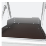
Plancher grand confort 600 x 400 mm antidérapant en bois éco-sourcé