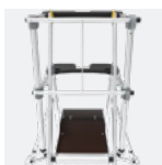
Garde-corps à lisses de protection antichute à fermeture semi-automatique