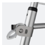
Stabilisateurs à réglage millimétrique

Produit certifié NF - Organisme certificateur : AFNOR Certification, 11, rue Francis de Pressensé, F-93571 La Plaine Saint Denis Cedex. Référentiel de certification : NF équipements de chantier (NF096) disponible sur www.marque-nf.com . Une plate-forme individuelle roulante (ou plate-forme individuelle roulante légère) certifiée NF doit impérativement être utilisée avec tous les éléments figurant dans la nomenclature du modèle. Tous droits réservés. Images non contractuelles.