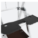
Tablette XL résistance 25 kg