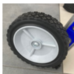
Roues tout-terrain crantées Ø175 mm