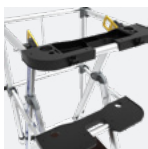
Double tablettes porte-outils amovibles interchangeables