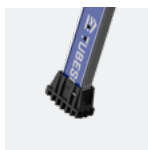
Sabots enveloppants antidérapants