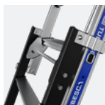
Marches 80 mm (plan fixe) et 60 mm (plan télescopique)