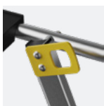
Anneaux de grutage